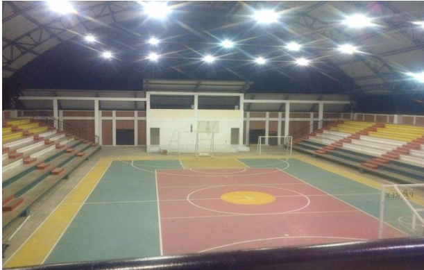
MANTENIMIENTO LUMINARIAS COLISEO