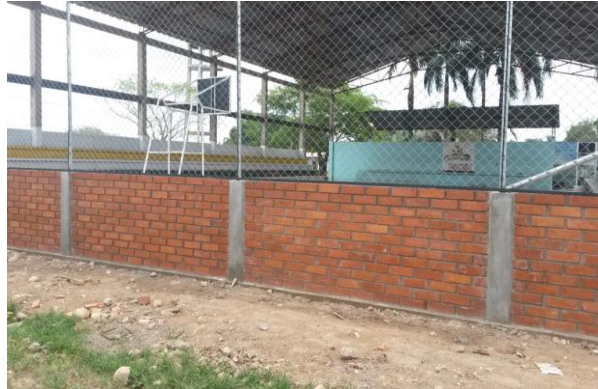
ADECUACION CANCHA CUBIERTA